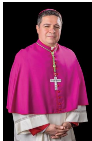
Obispo Evelio Menjivar

Las biografías del obispo Campbell y del obispo Menjivar están disponibles aquí .